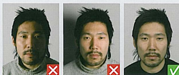
Skygge på ansigt