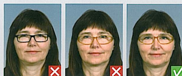
Stel dækker øjne