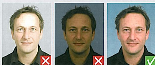
For lyst, skarp blitz