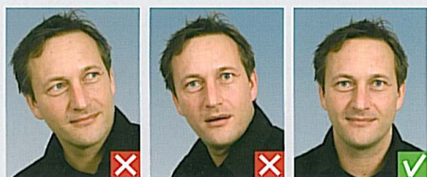
Kigger væk Hoved skævt