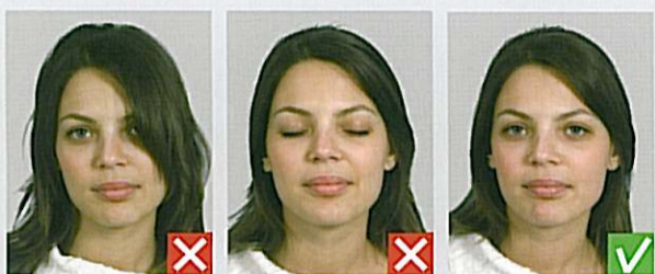
Øje dækket af hår

Baggrunden skal være uden motiver og i ensartet lys farve, f.eks. lys blå eller lys grå.