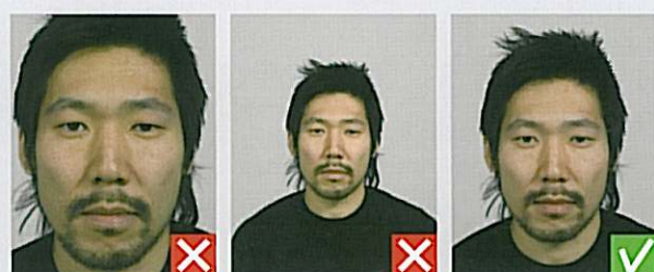
For tæt på

Blikket skal være rettet mod kameraet, øjnene helt synlige og munden lukket.